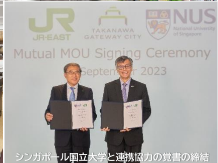
シンガポール国立大学と連携協力の覚書の締結