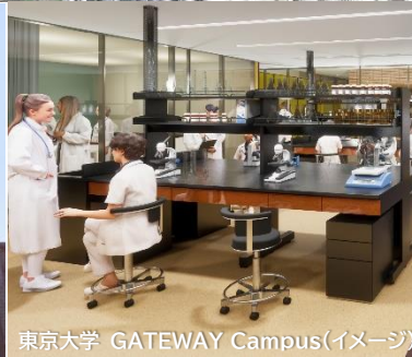
東京大学 GATEWAY Campus(イメージ)