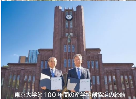
東京大学と100年間の産学協創協定の締結